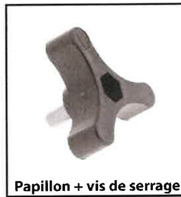
Papillon + vis de serrage

En cas de débordement de carburant, un nettoyage devra être fait avant de quitter le stand.