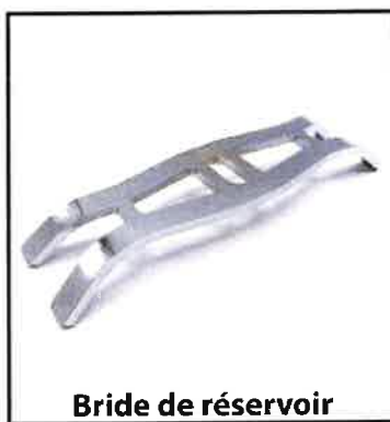
Bride de réservoir