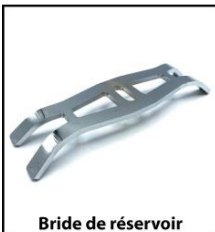
Bride de réservoir