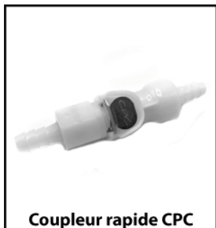
Coupleur rapide CPC

Le papillon doit être vissé à la main sans l'aide d'outil.