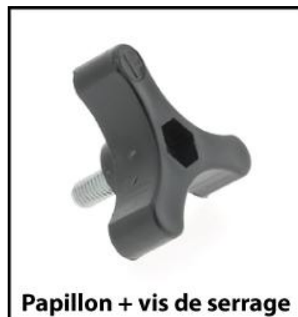
Papillon + vis de serrage

En cas de débordement de carburant, un nettoyage devra être fait avant de quitter le stand.